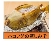
ハコフグの蒸しみそ